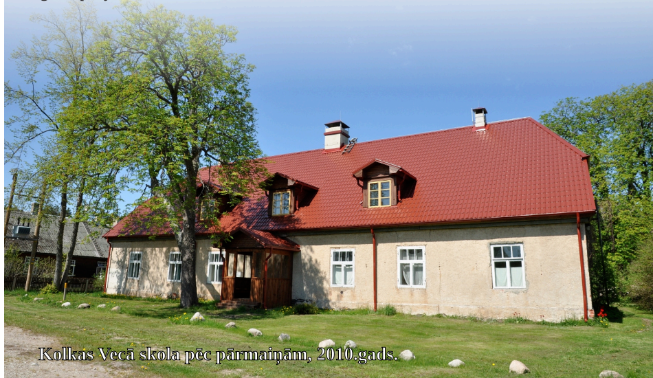
Kolkas Vecā skola pēc pārmaiņām, 2010.gads.

Taču visi veiktie darbi ir tikai daļa no iecerētajiem veicamajiem darbiem, lai šo unikālo ēku pārveidotu par teicamu, pilnībā labiekārtotu bioloģijas prakšu bāzi un starptautiska mēroga ekoloģisko pētījumu centru.