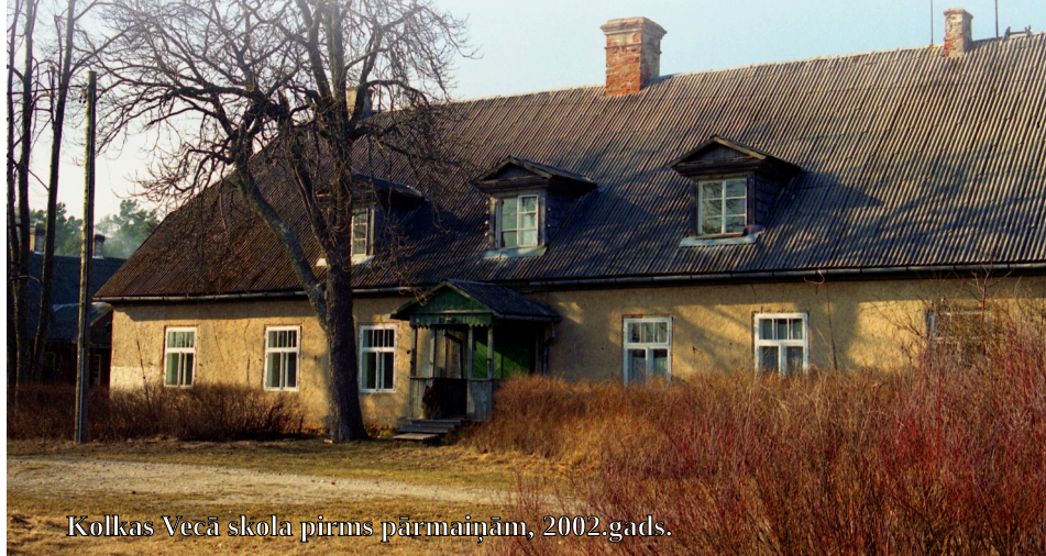
Kolkas Vecā skola pirms pārmaiņām, 2002.gads.

1989. gadā Latvijas Universitātes Bioloģijas fakultāte ievadīja sarunas ar Talsu Tautas izglītības nodaļu (TIN) par skolas nodošanu universitātes, tolaik Pēteru Stučkas Latvijas Valsts