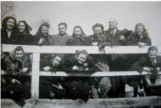
Studentu ekskursijā uz Ķemeriem 1950. gada rudenī.