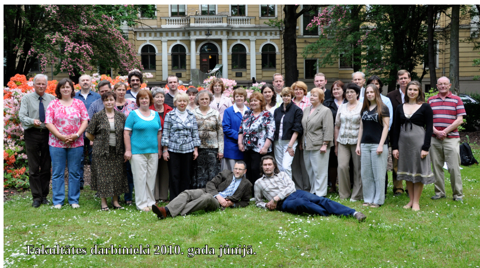
Fakultātes darbinieki 2010. gada jūnijā.

Latvijas Dabas fonds (Adrese: Dzirnava iela 73-2, Rīga, LV1011).